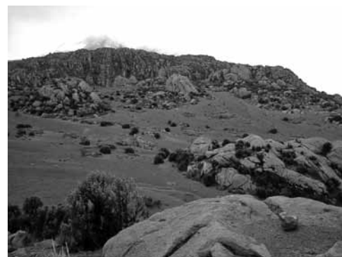
Foto Reserva Parque Natural los Nevados