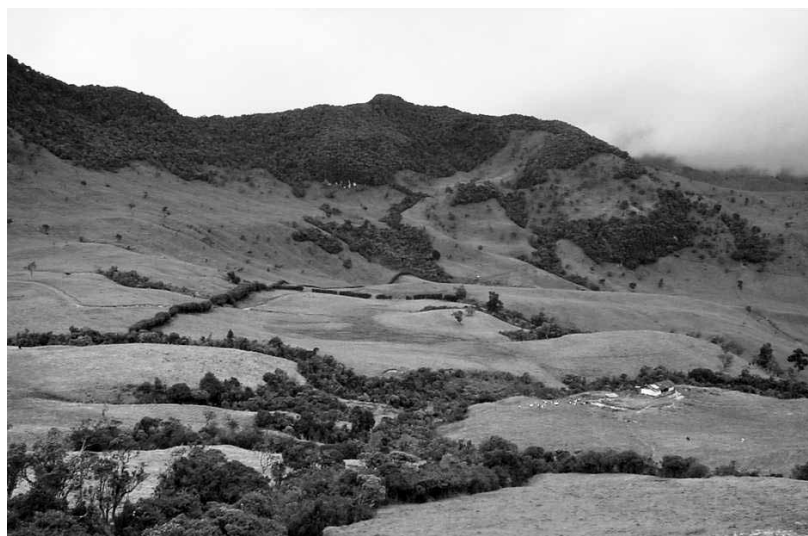
Foto Reserva Forestal de Río Blanco

Adicionalmente se ha realizado un esfuerzo por definir Áreas de Importancia para la Conservación de Aves –AICA- con el apoyo de organizaciones locales y regionales como Fundegar. Actualmente, existen 4 AICA: Reserva Forestal Protectora de Río Blanco y la Quebrada Olivares, Parque Nacional Natural Selva de Florencia, Bosques de Victoria (Bellavista) y Bosques del Riosucio (bosques montanos del sur de Antioquia).