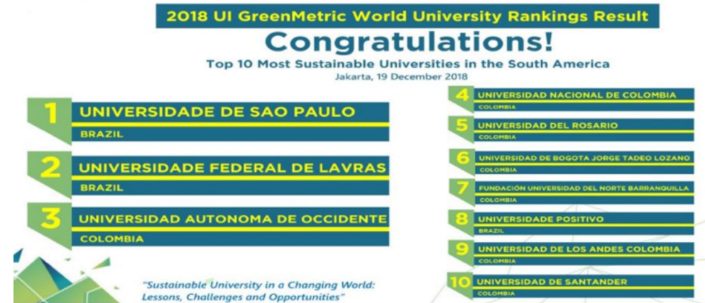
Figura N° 4. Primeras universidades suramericanas en el UI GreenMetric World University Ranking 2018 [Página web de UI GreenMetric World University Ranking]. (2019). Recuperado de http://greenmetric.ui.ac.id/

La Universidad Nacional de Colombia ocupó en 2018 el puesto N° 51 en el orden mundial y el cuarto lugar en desempeño ambiental en el ámbito suramericano.