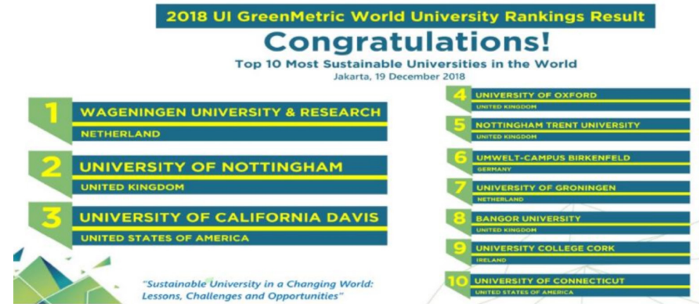
Figura N° 3. Primeras universidades del mundo en el UI GreenMetric World University Ranking 2018 [Página web de UI GreenMetric World University Ranking]. (2019). Recuperado de http://greenmetric.ui.ac.id/

De 719 universidades de 81 países del mundo, los primeros puestos en desempeño ambiental en 2018 se distribuyeron así: