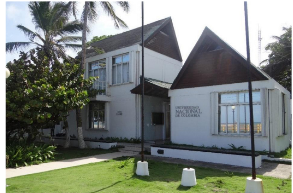
Figura N° 5. Universidad Nacional de Colombia Sede Caribe

[Página web de UI GreenMetric World University Ranking]. (2019). Recuperado de http://greenmetric.ui.ac.id/