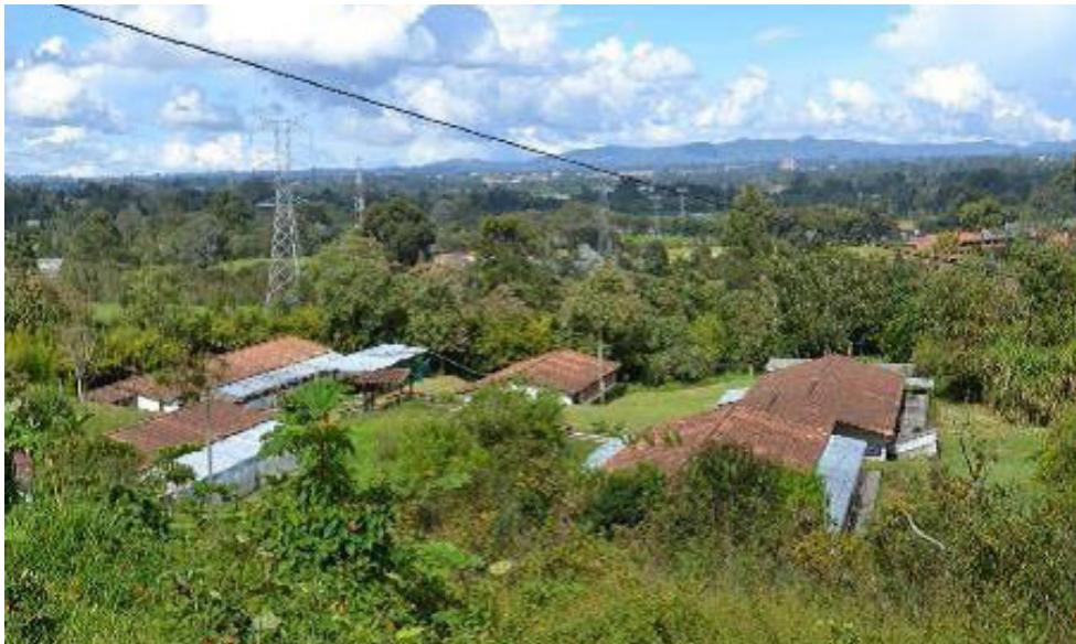
Figura N° 7. Universidad Nacional de Colombia Sede Medellín (Granja San Pablo)