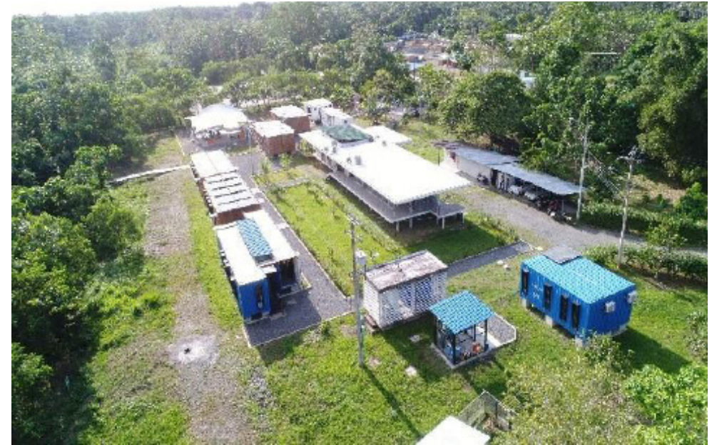
Figura N° 8. Universidad Nacional de Colombia Sede Tumaco