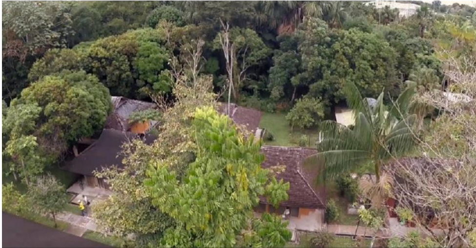
Figura N° 6. Universidad Nacional de Colombia Sede Amazonas