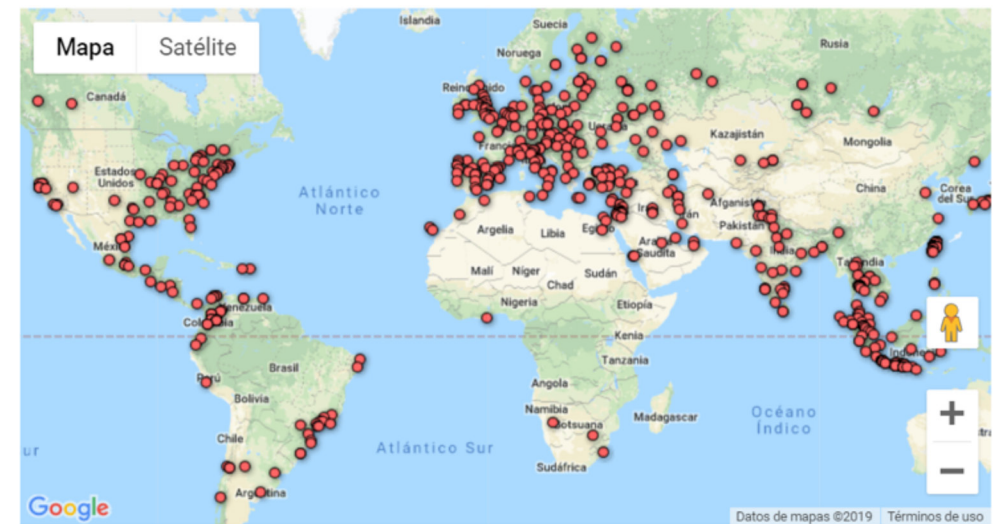
Figura N° 2. Localización de universidades en el UI GreenMetric World University Ranking [Página web de UI GreenMetric World University Ranking]. (2019). Recuperado de http://greenmetric.ui.ac.id/

Es importante identificar las universidades que lideran este camino, (ver figura N° 2); se recopilan y procesan gran cantidad de datos para obtener una puntuación única que refleje los esfuerzos realizados por las IES en la implementación de políticas y programas respetuosos con el medio ambiente. Se espera que dicha clasificación sea útil para impulsar mayores esfuerzos y gestionar un cambio en la comunidad académica, razón por la cual se emplea un conjunto de criterios clave, que cada vez se evalúan, mejoran y refinan en cada versión, en conjunción con otros rankings universitarios de orden mundial.