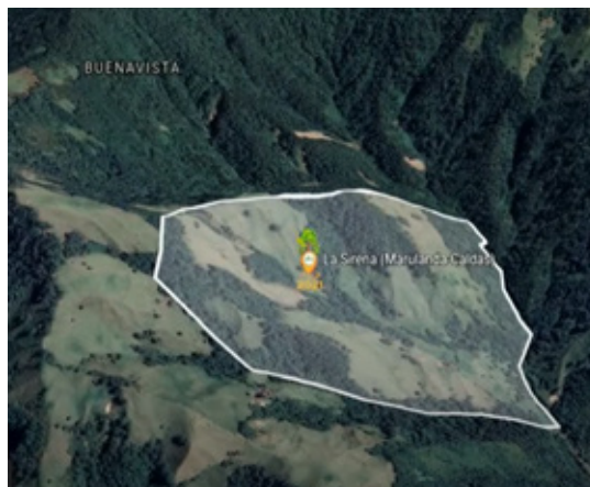
4. Predio La Sirena en Marulanda

El sendero del cuidado del medioambiente necesita de compromiso. El trabajo tras las 500 hectáreas de predios que adquirirá la Gobernación