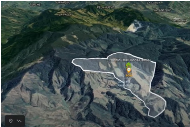
5. Predio El Jordán en Marulanda

de estos procesos. Gracias a ellos se forma una sinergia bellísima entre la gestión gubernamental y el empoderamiento ciudadano.