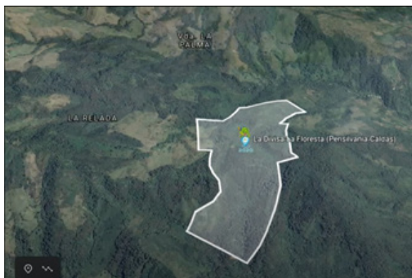
2. Predio La Divisa y La Floresta en Pensilvania

El mantenimiento, reforestación, vigilancia y cercamiento de algunos terrenos son los factores que generan efectivamente la protección biológica que buscamos de estos ecosistemas. Para asegurar este aspecto, en agosto del 2020 firmamos la Alianza Caldense por el Agua, entre la Gobernación, a través de la Secretaría de Vivienda y Territorio y de su componente ambiental; Corpocaldas e Inficaldas. Aunamos esfuerzos mediante un convenio interadmi-