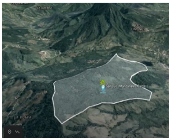
3. Predio San Luis en Manzanares