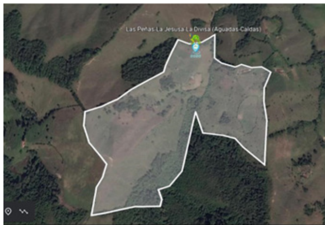
1. Predios Las Peñas, La Jesusa y La Divisa en Aguadas

Los caldenses deben estar tranquilos al saber que hay un doliente ideal e idóneo para la ejecución de temas ambientales en la Gobernación. En este sentido, tenemos proyectado comprar en este cuatrienio, 500 hectáreas (ha) de predios estratégicos ubicados en zonas de importancia ecológica. Este proceso se hace de la mano de la Secretaría de Medio Ambiente y desde el componente ambiental de la Secretaría de Vivienda y Territorio. El propósito es proteger la biodiversidad del departamento y cuidar el recurso hídrico que abastece el sistema de acueducto de los caldenses.