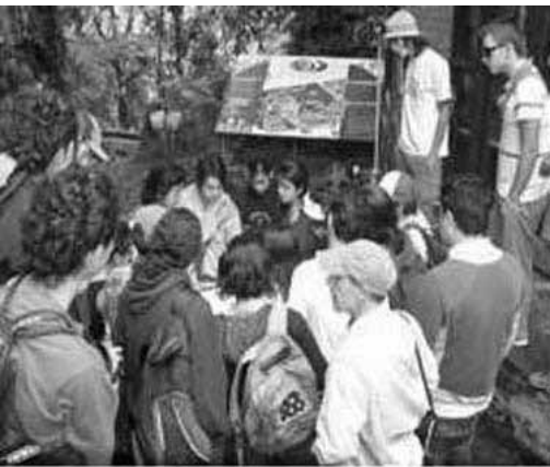
■ Educación Ambiental

A manera de trepanar en los discursos modernos y dar otra mirada en el sentido de crear tramas y urdimbres en la construcción de nuestro Habitar, es un desafío que tenemos todos como parte de la tierra, desde cada una de nuestras disciplinas y es responsabilidad de nosotros los arquitectos, de los planificadores urbanos y las escuelas de arquitectura, plantear nuevas alternativas en el desarrollo y construcción de ciudad, una manera diferente de interpretar el concepto de arquitectura; la Bioarquitectura que se constituye en un componente estratégico como aporte a la sostenibilidad urbana pero dentro de nuestro contexto. Y desde los imaginarios de sus habitantes, una planificación ambiental urbana participativa en que el sentido de pertenencia, obligue a “las esferas políticas” a generar un mejor medio ambiente en nuestras ciudades como un derecho fundamental en la calidad de nuestra vida.