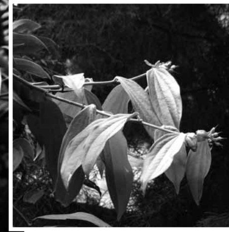
■ Especies del Ecoparque Central Universitario