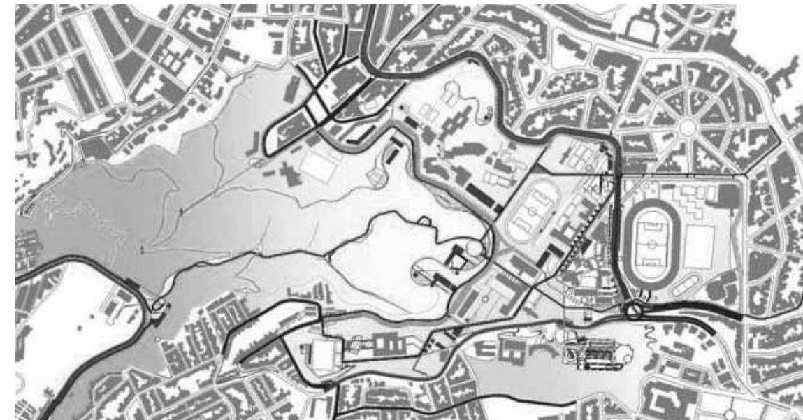
Propuesta de movilidad