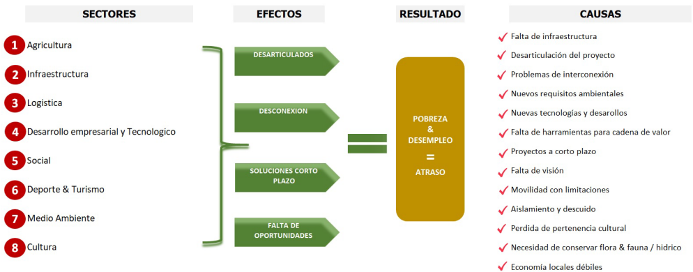
Gráfico 1. Árbol de problemas Bio-Ruta Transversal de Caldas

El siguiente gráfico resume, en un árbol de problemas, las necesidades a satisfacer: