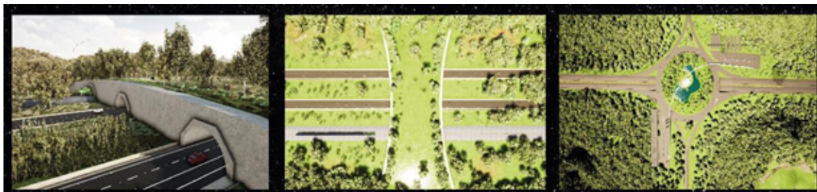
Gráfico 8. Vistas de pasos de fauna, ecoductos y rotondas en conexión con los municipios que integran la Bio-Ruta Transversal de Caldas

Por la singular integración ecosistémica y cultural, en 150 kilómetros de recorrido de variada condición bioclimática, alta biodiversidad y pertenencia al Paisaje Cultural Cafetero de Colombia Patrimonio de la Humanidad, se potencia la industria turística sostenible en sus distintas modalidades: científica, ecoturística, agroturística, cultural y recreativa de impacto económico y social.