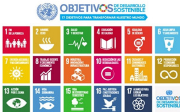
Gráfico 2. Objetivos de Desarrollo Sostenible (ONU) integrados en los objetivos de la Bio-Ruta Transversal de Caldas