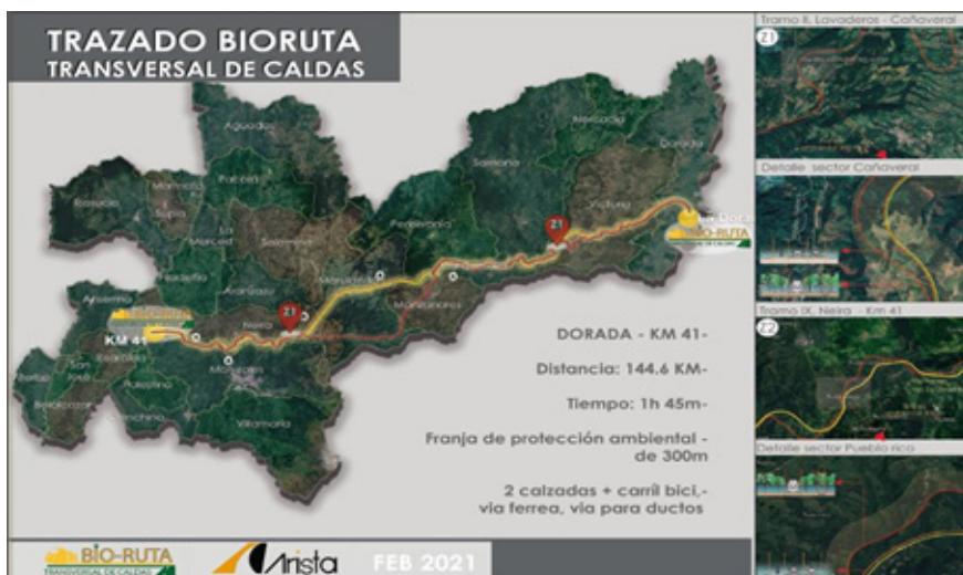
Gráfico 4. Vista 3D doble calzada y calzada de ferrocarril

El trazado de la Bio-Ruta Transversal de Caldas partió de la revisión de los perfiles y distancias de los tramos existentes y, de su posible rectificación para alcanzar velocidades de diseño de 80 kilómetros por hora en las partes planas y onduladas y de 60 kilómetros en las partes altas. Entre La Dorada y el kilómetro 41 de Manizales se pasa por la margen izquierda del río La Miel, aguas arriba, hasta atravesar el farallón donde nace el río, a través de un primer túnel que conducirá a Marulanda en la cuenca del río Guarinó, además de un segundo túnel de diez kilómetros. La vía continúa por el río Guacaica en su aproximación a Manizales y Neira hasta el kilómetro 41 de Manizales. Se consideró, que ninguno de los tramos debe atravesar las cabeceras municipales, para fomentar su desarrollo económico sin interferir en su conservación patrimonial.