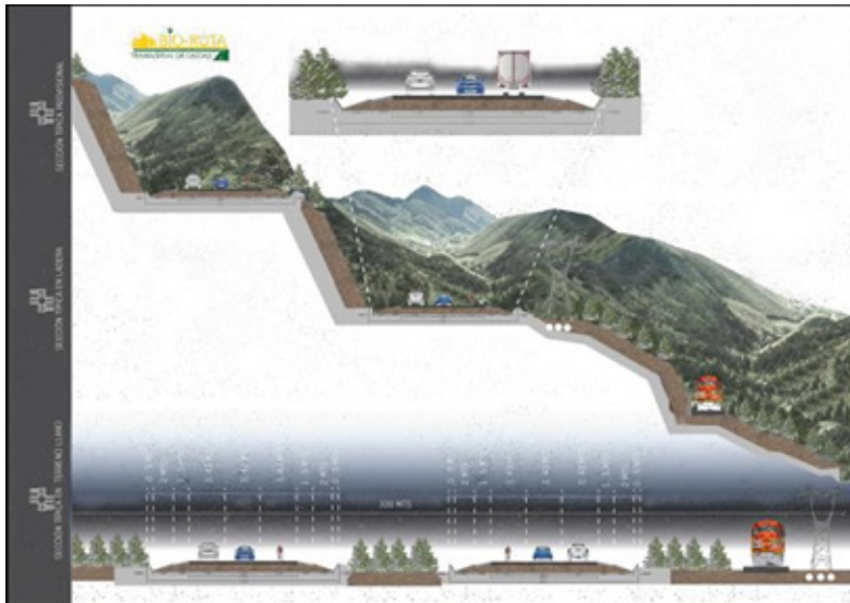
Gráfico 5. Secciones tipo Bio-Ruta Transversal de Caldas

Al reducir significativamente los tiempos de viaje hacia Manizales ninguna población de Caldas quedaría a más de dos horas de la capital del Departamento, así: Neira a 12 minutos, Viterbo y Marulanda a 43 minutos, Manzanares, Marquetalia, Victoria, Salamina, Pensilvania y Pácora a 1:30 horas, Samaná a 2 horas aproximadamente, La Dorada y Aguadas a 1:45 horas.