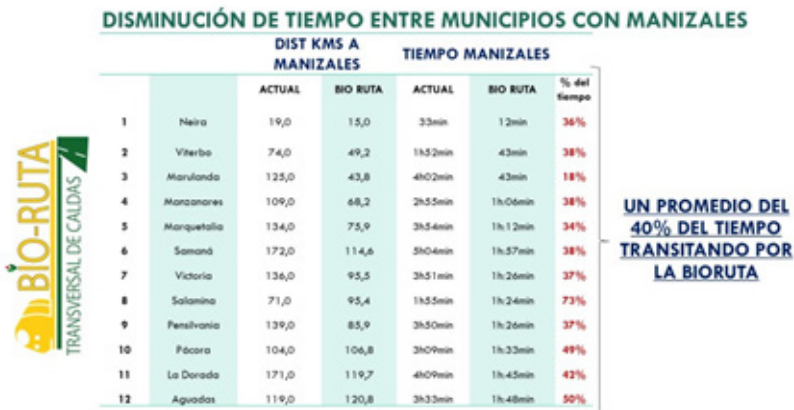
Gráfico 6. Disminución de tiempo entre municipios con Manizales