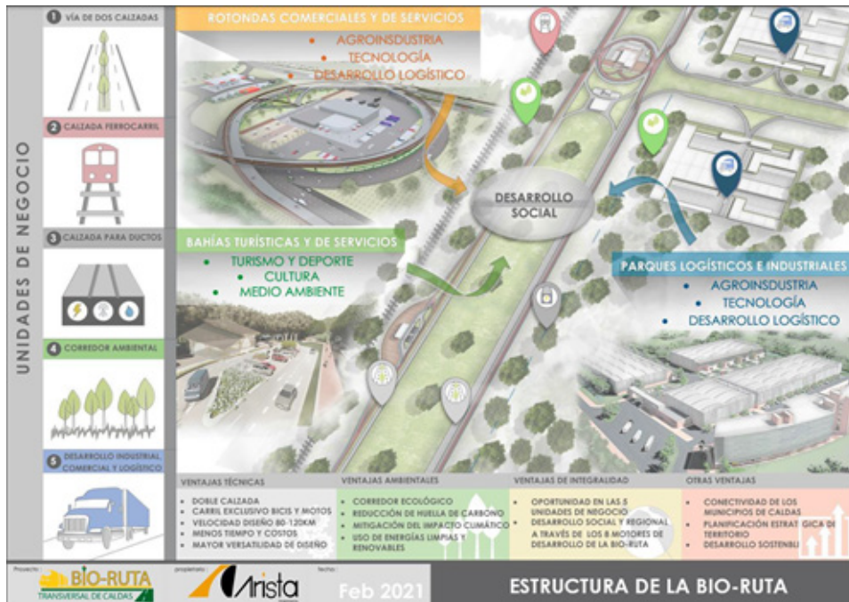
Gráfico 7. Motores de desarrollo económico como unidades de negocio Bio-Ruta Transversal de Caldas