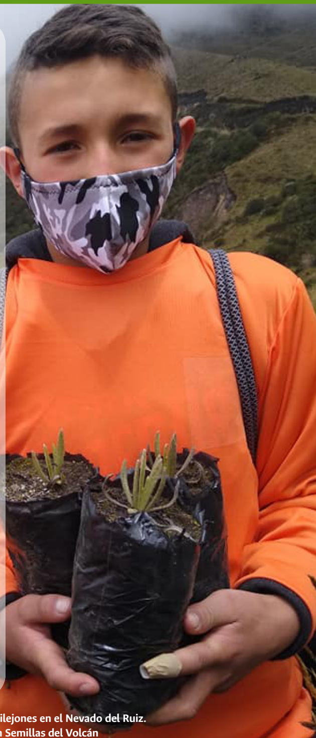
Imagen 20. Sembratón de frailejones en el Nevado del Ruiz.

• Alianzas con el Servicio Geológico Colombiano e instituciones educativas rurales que han per-