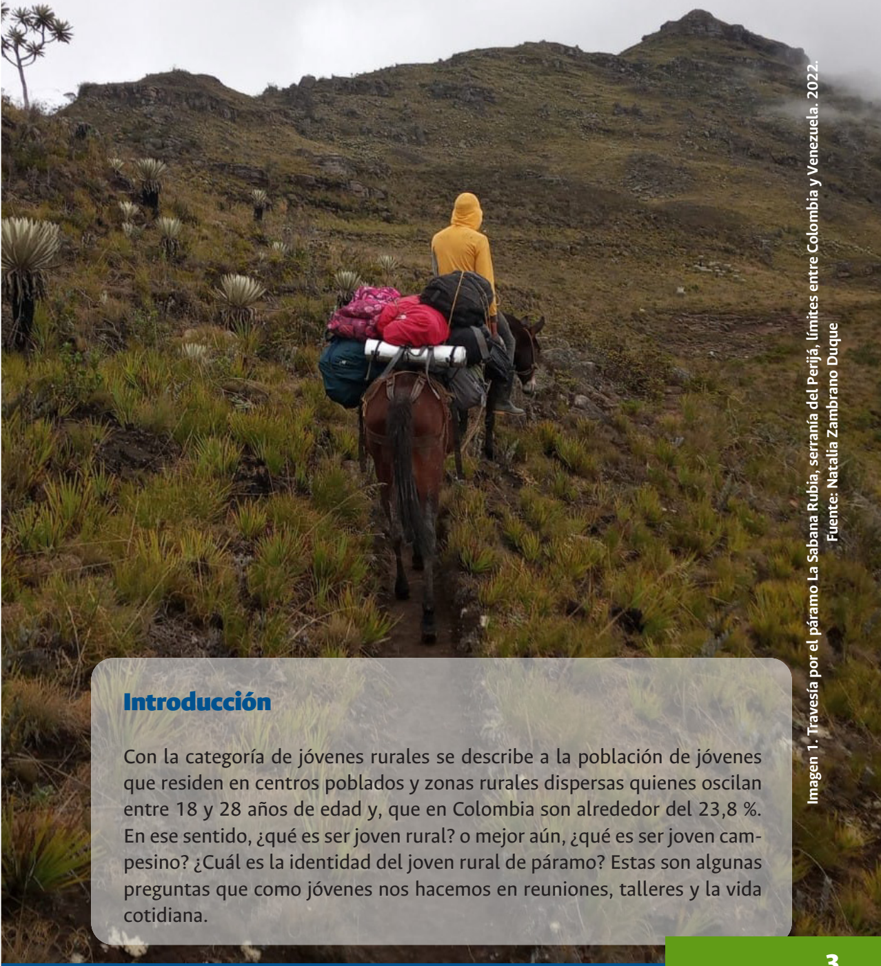
Imagen 1. Travesía por el páramo La Sabana Rubia, serranía del Perijá, límites entre Colombia y Venezuela. 2022.