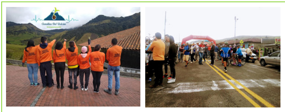
Imágenes 26 y 27 Grupo focal de jóvenes del territorio como vigías y guías locales. Activación de la economía local a partir de eventos de carácter deportivo.