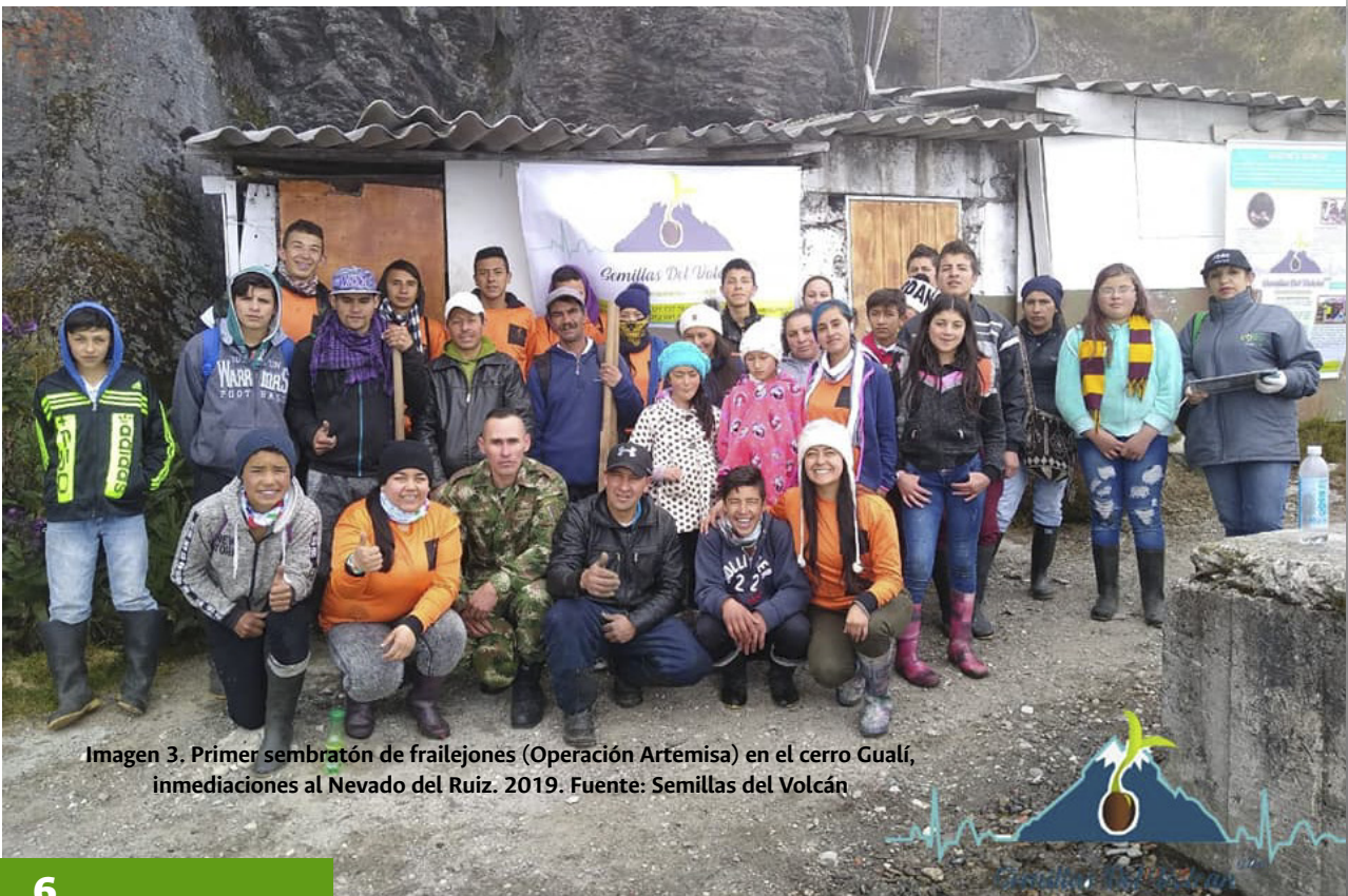
Imagen 3. Primer sembratón de frailejones (Operación Artemisa) en el cerro Gualí, inmediaciones al Nevado del Ruiz. 2019.