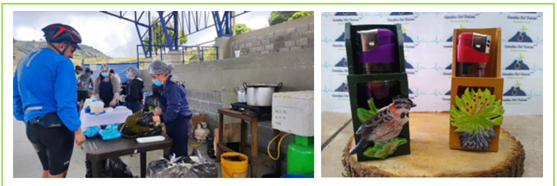
Imágenes 22 y 23. Venta de alimentos en el marco del Reto Mariquita-Letras. Artesanías ParamoArte.

Emprendimiento rural: generación de alianzas estratégicas con organizaciones, personas e instituciones, para fortalecer las capacidades locales de la población rural en términos formativos, para la creación de productos innovadores, que les brinden mejores oportunidades en el mercado local y, a su vez, una sostenibilidad económica.