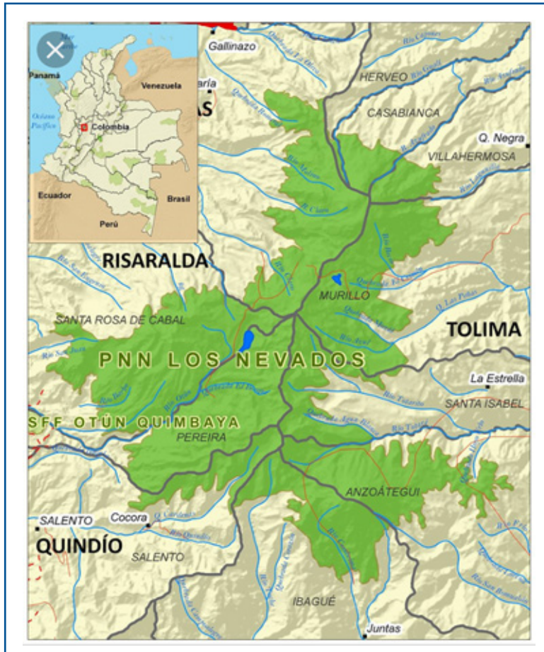
Imagen 8: Ubicación geográfica del Parque Nacional Natural Los Nevados (PNNN), cordillera Central de los Andes colombianos 4 .

4. Tomado de: Parques Nacionales Naturales. Parque Nacional Natural Los Nevados. Ubicación geográfica de los Parques Nacionales Naturales de Colombia.