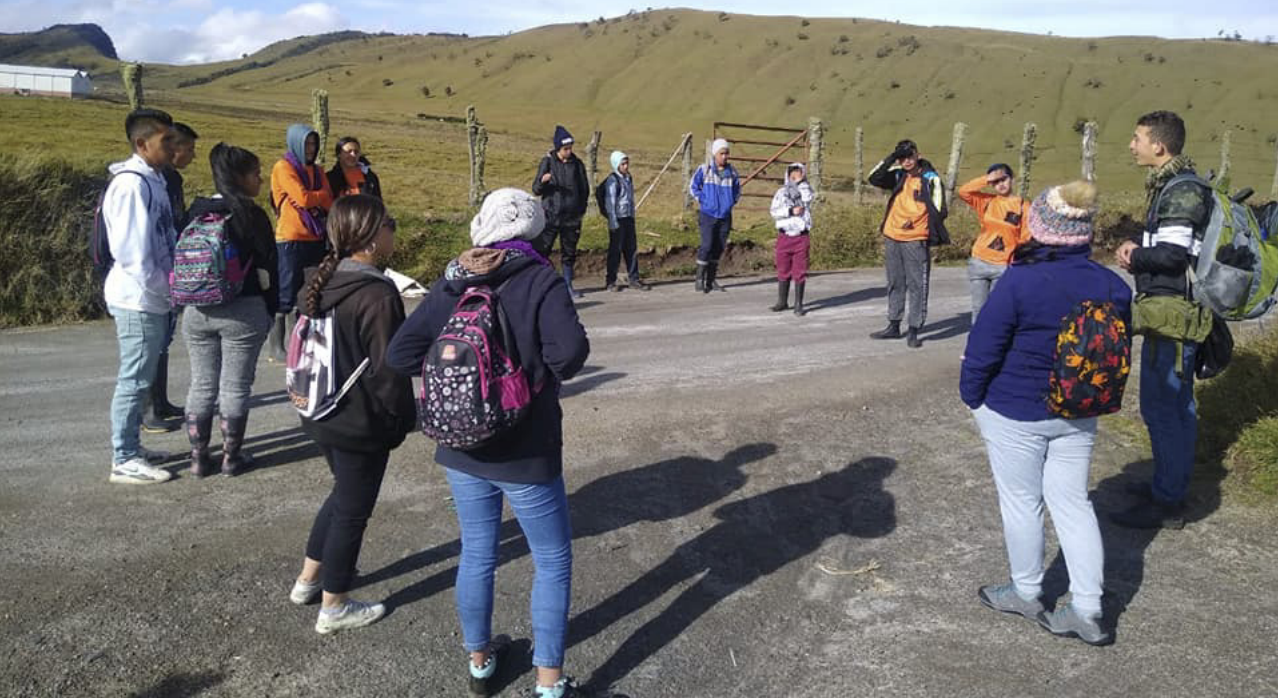
Imagen 21. Salida interpretativa de reconocimiento del ecosistema de páramo.