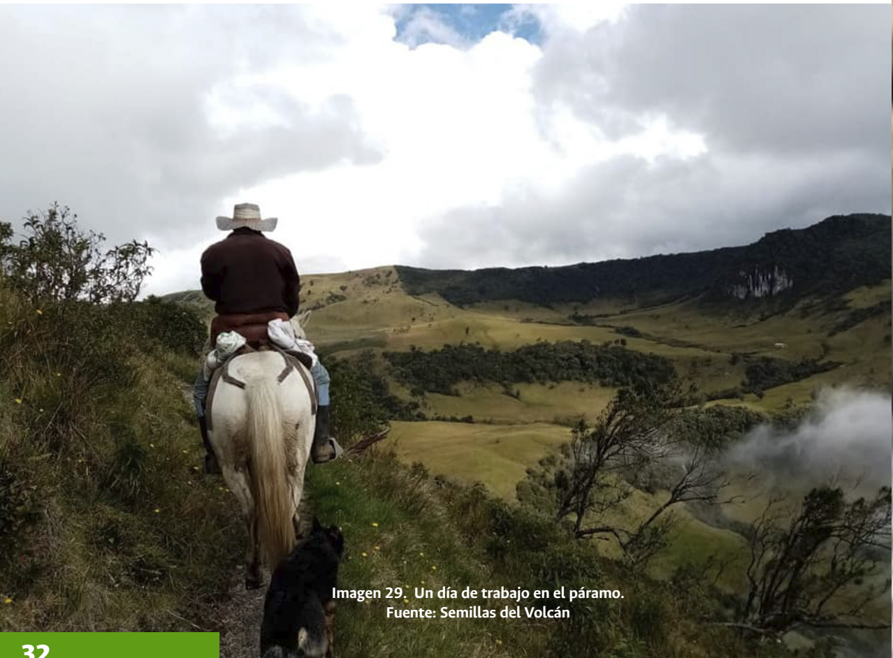
Imagen 29. Un día de trabajo en el páramo.

Por esta razón, nuestra organización busca apoyo y alianza con diferentes instituciones, para lograr la sostenibilidad de esta causa social que nos convoca, ya que este proceso se ha realizado de manera voluntaria y sin soporte gubernamental o privado y sus fundadoras trabajan sin ninguna retribución económica.