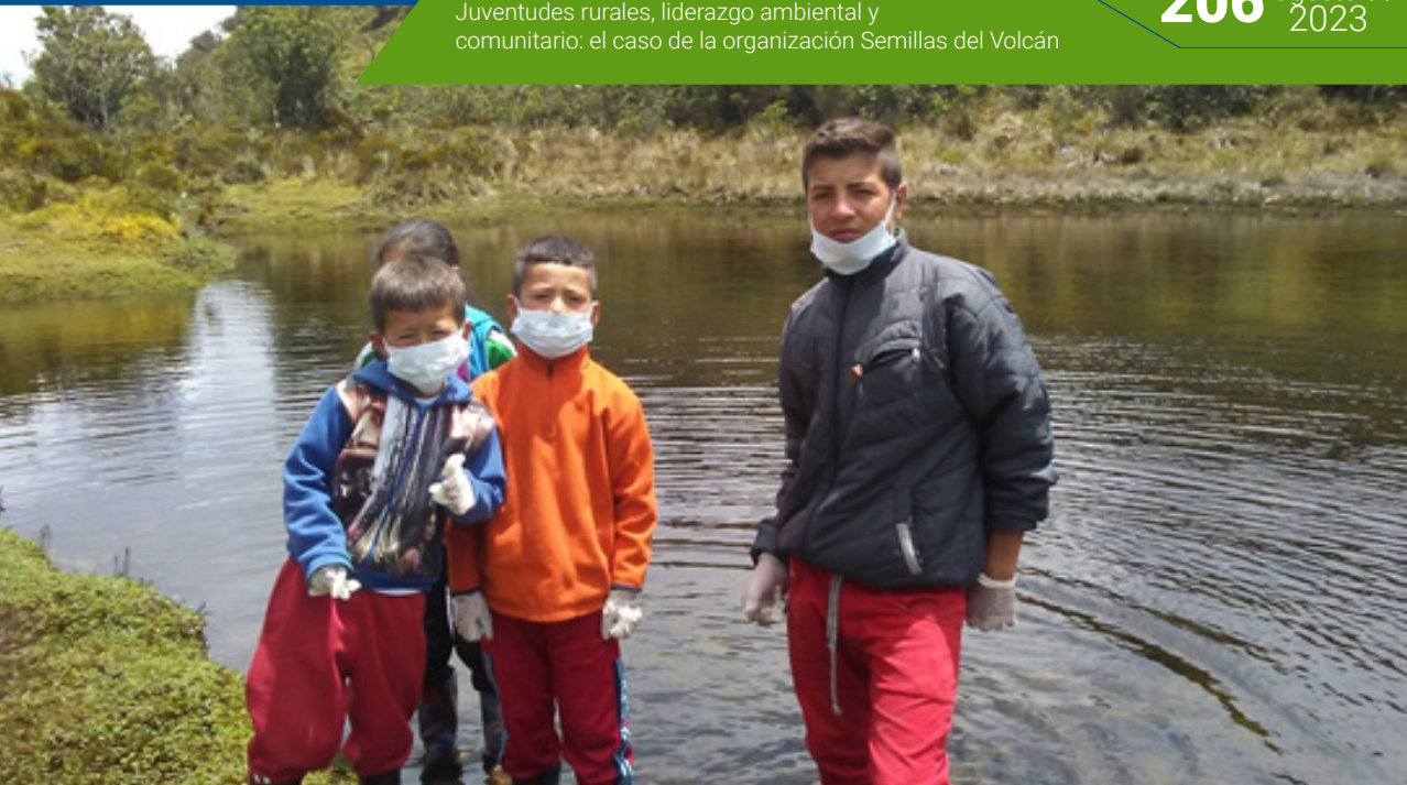
Imagen 5 Limpiatón del páramo, sector lagunas en el Alto de Letras.

La asociatividad juvenil es una potencialidad emergente que está tomando fuerza en Colombia y se ha gestado como alternativa de resistencia y permanencia, frente a los impactos del conflicto armado interno, de las pocas oportunidades locales y del desconocimiento de su potencialidad, recurrente en lo rural y que ha afectado directamente a los jóvenes (Rodríguez. 2002: 55), ya que, carentes de todo tipo de amparo social, han sido víctimas de reclutamientos por actores armados externos, bajo promesas de mejores oportunidades (Preciado. 2000:18).