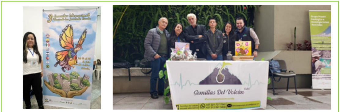
Imágenes 24 y 25. Participación en el Tercer encuentro internacional Potenciando las Juventudes Rurales 2023. Participación en el encuentro de Geoparques Mundiales UNESCO 2019.