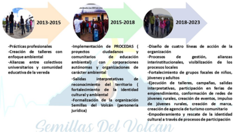
Imagen 19. Línea de tiempo del trabajo comunitario y ambiental en el páramo.