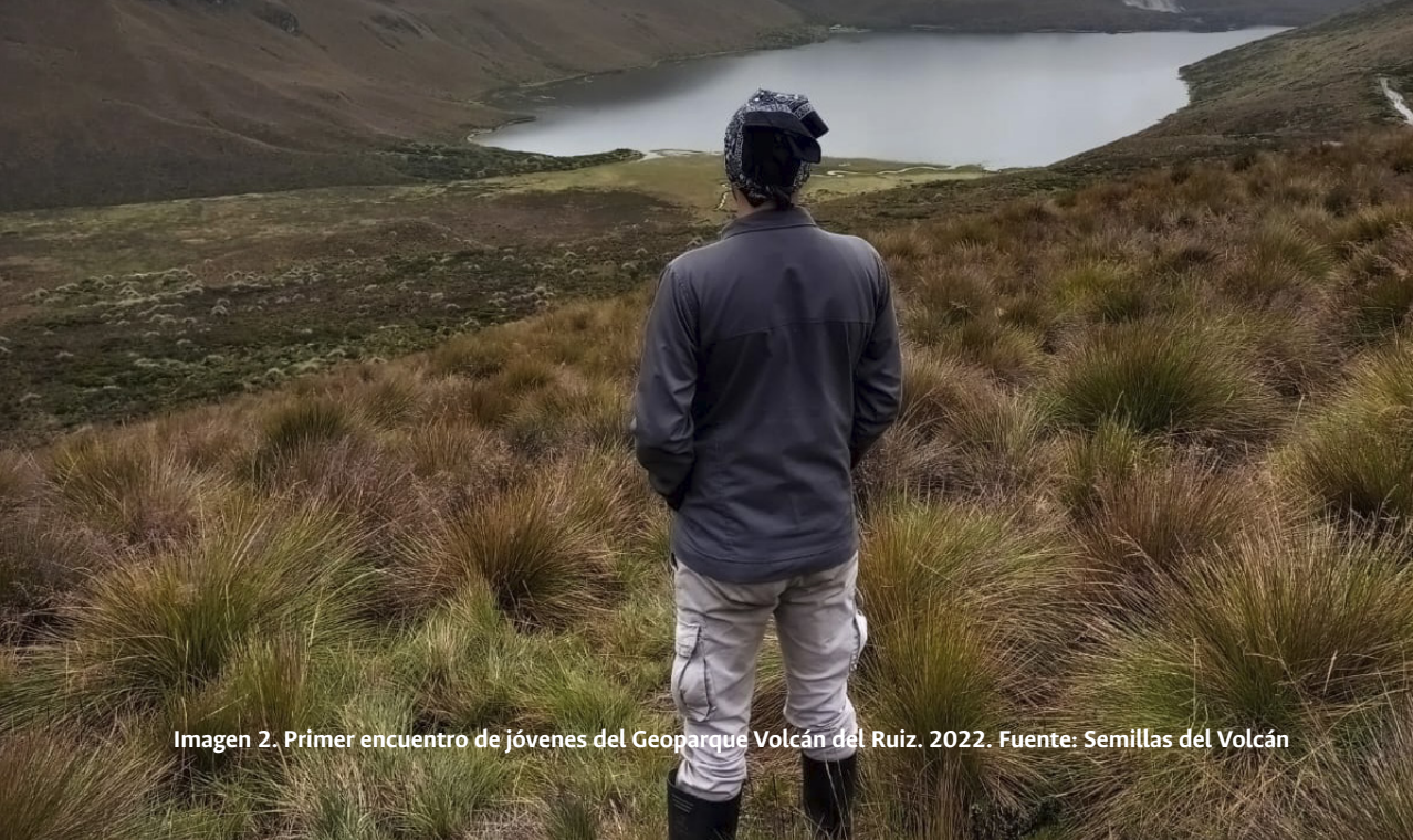
Imagen 2. Primer encuentro de jóvenes del Geoparque Volcán del Ruiz, 2022.

Sin lugar a dudas todas estas cuestiones pasan necesariamente por unas categorías que compartimos con otros jóvenes rurales, las cuales tienen que ver con la dificultad para acceder a los derechos mínimos para la garantía de una mejor calidad de vida; el acceso a la educación, a la salud, al mercado laboral y a cerrar las brechas sociales y culturales que se imponen para ser garantes de dichos derechos. A su vez, hay un surgimiento de nuevas miradas hacia los conflictos ambientales: impactos por cambio climático, migración rururbana, falta de regulación de actividades antrópicas en los ecosistemas estratégicos como los páramos. El caso de la zona de influencia del páramo de los nevados -Parque Nacional Natural Los Nevados (PNNN), referente al Sistema Nacional de Áreas Protegidas (SINAP) no es ajeno a estos conflictos; el surgimiento de organizaciones de carácter comunitario y ambiental en dicho territorio permiten visibilizar y fortalecer los procesos de agenciamiento sobre el cuidado y la conservación; es el caso de la organización Semillas del Volcán que mediante la educación y la participación juvenil une esfuerzos por la concienciación ambiental del páramo. Dicha organización nace del interés de trabajar procesos de carácter socioambiental por medio de cuatro líneas de acción, orientadas a la