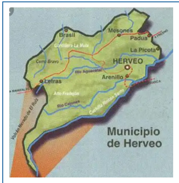
Imagen 10. Mapa administrativo del municipio de Herveo Tolima.