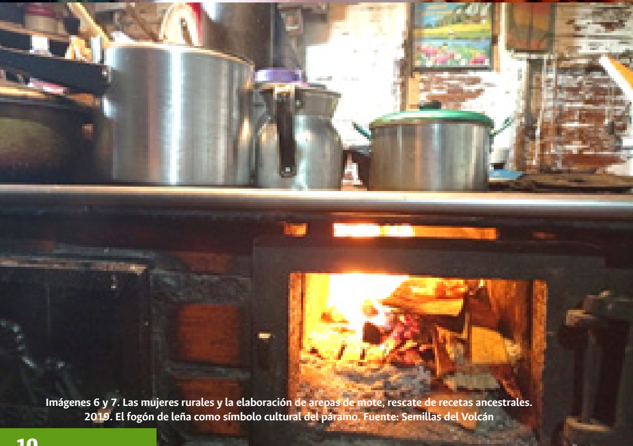
Imágenes 6 y 7. Las mujeres rurales y la elaboración de arepas de mote, rescate de recetas ancestrales. 2019. El fogón de leña como símbolo cultural del páramo.

La inclusión productiva de los jóvenes rurales se ve afectada no solamente por deficiencias en el acceso a oportunidades laborales y de emprendimiento, sino por brechas de género. Mientras el 8 % de hombres jóvenes en el campo ni estudian ni trabajan, la proporción es cinco veces mayor para las mujeres, es decir el 42 % (RIMSP, 2017) En (CONPES 4040, 2021: 51)