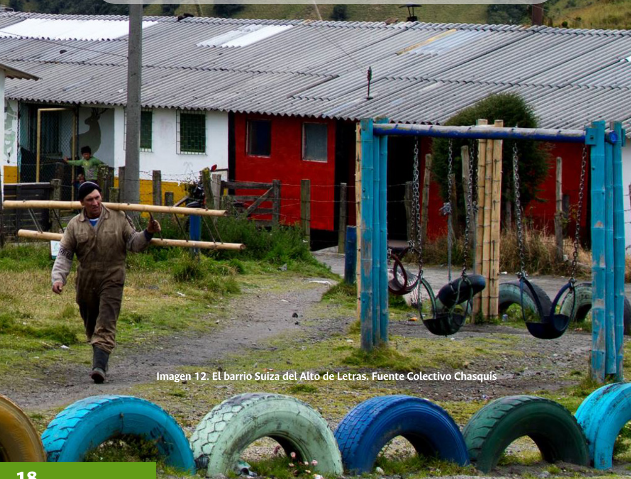
Imagen 12. El barrio Suiza del Alto de Letras.

La pérdida de saberes ancestrales intergeneracionales es también un signo de la poca comunicación entre los habitantes de la vereda, de la migración o del fallecimiento de los adultos mayores, lo que ocasiona poca conexión de las nuevas generaciones con su territorio.