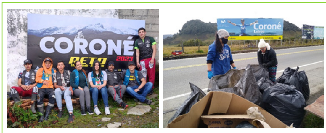
Imágenes 14 y 15 Jóvenes rurales del territorio participando en la logística del evento: Reto Líbano-Nevado-Alto de Letras.

Actualmente, el sector comercial del Alto de Letras está presentando una transformación debido a dinámicas culturales, turísticas, ambientales y deportivas, puesto que, por la imponente geografía y clima de este territorio hay un aumento en la presencia de los deportistas de alta montaña, las agencias de turismo, los investigadores de diferentes instituciones, entre otros, quienes activan la economía local y posicionan el territorio haciendo que se generen nuevas necesidades de servicios, que a la vez, pueden ser una oportunidad para la comunidad, en especial para los jóvenes.