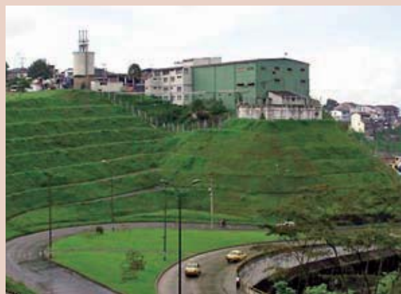
Foto 5: Obras de estabilización de taludes.

De otro lado, la entidad ha desarrollado un esquemametodológicoconducenteacaracterizar desde el punto de vista geotécnico los diferentes tipos de procesos de inestabilidad en Caldas, de tal manera que a través de procedimientos simples y rápidos puedan definirse las obras y acciones óptimas desde el punto de vista técnico, económico, social y ambiental, para la solución de los problemas caracterizados. Estos desarrollos son la herencia positiva de lo que desde los años 70 se desarrolló en Manizales, resultado de los múltiples deslizamientos que el proceso de urbanización disparó. CORPOCALDAS es reconocida como una corporación líder en la reducción del riesgo por deslizamientos.