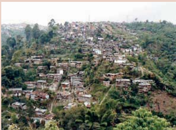
Fotos 2A y 2B: Barrios vulnerables en áreas de influencia de amenazas siconaturales.

La amenaza volcánica. Representada principalmente por la caída de cenizas, en caso de erupción del volcán Nevado del Ruiz. Estas cenizas pueden llegar a recubrir la ciudad por efecto de los vientos alisios. La última caída de cenizas sobre la ciudad ocurrió el 1 de septiembre de 1989 (Abramovsky, 1990; en Chardon, 2002).