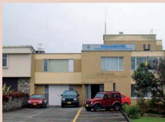
Foto 4: Observatorio Vulcanológico y Sismológico de Manizales.

La microzonificación sísmica. Realizada para la Alcaldía de Manizales en el año 2002 por el Centro de Estudios en Desastres y Riesgos (CEDERI) de la Universidad de los Andes con base en trabajos que se hicieron paulatinamente durante más de diez años. Se evaluaron los efectos sísmicos locales del suelo de acuerdo con las características geotécnicas y geológicas de zona y se especificaron los requisitos y recomendaciones de diseño y construcción sismorresistente en cada una de ellas. Esta microzonificación ha hecho posible que se desarrollen posteriormente herramientas importantes para la evaluación del riesgo sísmico de Manizales.