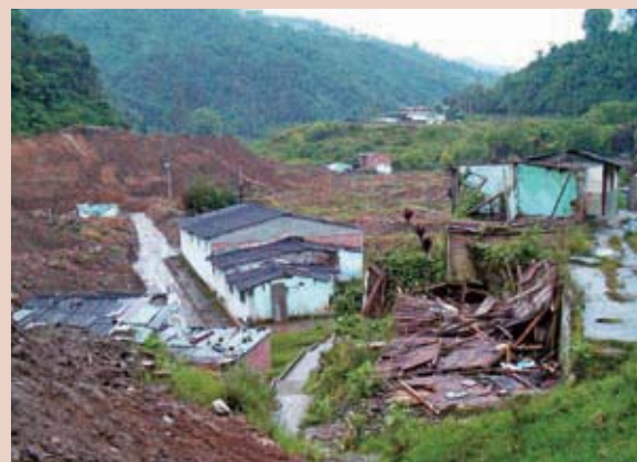
Foto 3: Viviendas destruidas por deslizamientos.

Otros deslizamientos se presentaron en septiembre, noviembre y diciembre, dejando como saldo algunos muertos, varios heridos, viviendas destruidas y obstrucción del tráfico entre otros. En el año 2003 y en uno de los eventos ocurridos 4 , se detectaron más de 90 deslizamientos, que ocasionaron 18 pérdidas de vidas humanas, 32 personas heridas, con el resultado adicional de 811 familias damnificadas y 74 viviendas destruidas, 104 quedaron afectadas. Fueron evacuadas 635 viviendas y 1 700 quedaron en zonas de riesgo.