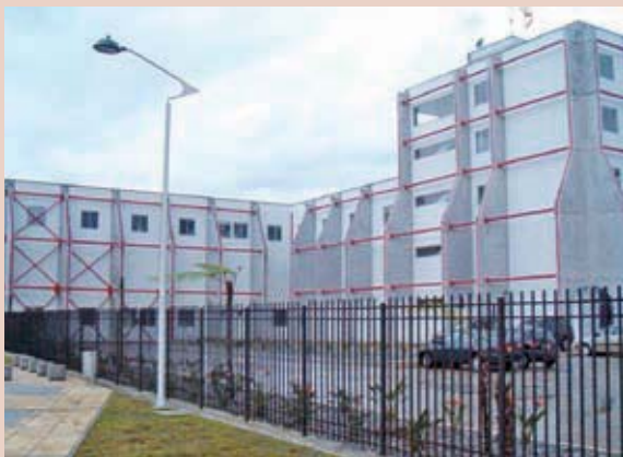
Foto 6: Reforzamiento Estructural en el Hospital de Caldas.

Una de las más notables demostraciones de voluntad política ha sido la inversión decidida en reducir el riesgo sísmico en forma preventiva de edificaciones importantes públicas esenciales, patrimoniales, vitales, de carácter local, departamental e incluso del sector privado mediante incentivos. Algunas intervenciones realizadas han sido comentadas en diversos congresos y eventos internacionales de refuerzo estructural sismorresistente por sus propuestas innovadoras que son de interés académico y práctico en la ingeniería internacional.