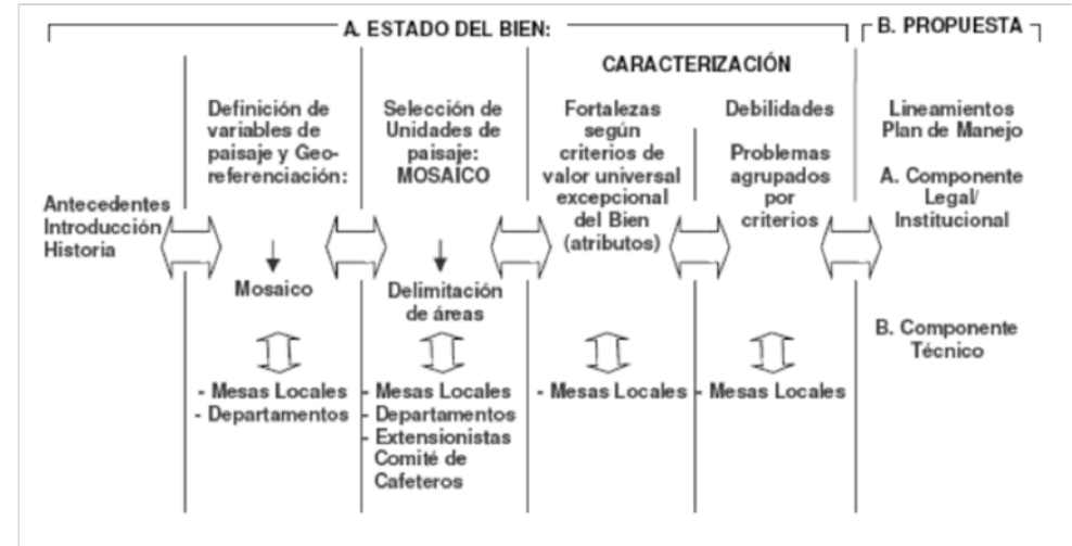
Gráfico No 3. Propuesta de Delimitación del Área Principal y de Influencia Tentativa a octubre de 2008